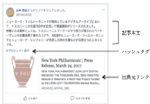
図 投稿記事の例（デスクトップ版）