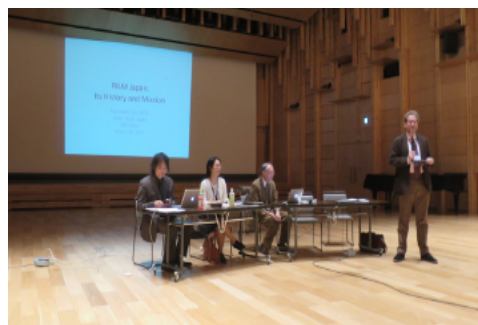
セッションの様子

現実的問題として、文献を集めるためには経費がかかると同時に、集めれば集めるだけ、それを公表するための経費も増大するという構造的な問題がある。さらに、日本の音楽資料については、日本語のローマ字化による同音異義語の問題や英訳のためのコストの増大（小塩氏の指摘）、日本のポピュラー音楽関係の文献資料が十分に拾い切れていない現状（川本氏の指摘）を改善する必要がある。また、国内版目録の冊子体による発行を継続するかどうかという点は、経費節減の観点から毎回出る話題ではあるが、イタリアやブラジルでも国内向けの冊子が発行されていることは意外であった。何れにせよ、そうした作業のかなりの部分がボランティアとして行われている問題は、RILM 日本支部の活動を今後も継続的に維持して行く上で、いずれは解決しなければならない点であろう。