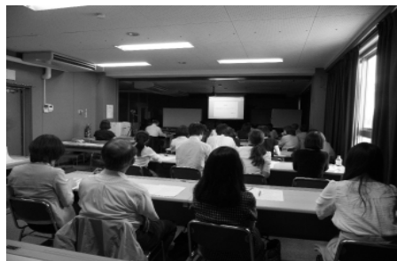
例会参加者の様子