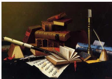
(Music and Literature by W. M. Harnett. https://commons.wikimedia.org/wiki/File:Music_and_Literature_William_Michael_Harnett.jpeg )