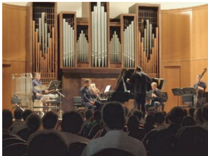
モスクワ音楽院小ホール現代音楽コンサート