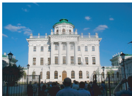
パシコフ・ドム