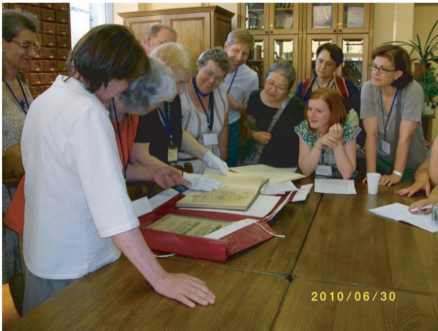
グリンカ音楽博物館の資料室で