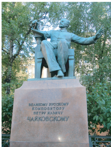
音楽院の チャイコフスキー像