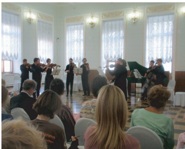
Pretum Integrumのパロックコンサート

なりました。http://opac.rism.info です。早速試みてみましたが、快適に情報を得られます。