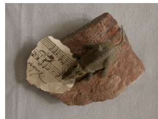
コレクションの資料をかじってしまったという いわれのあるネズミのシンボル・マーク

本会議は、スウェーデンという国は、豊かな音楽文化を有しているのだということを十分にアピールしてくれたように思う。これについては本誌の他の記事で詳しく報告されるであろうから、ここでは省略する。その筆頭がUppsala University Library所蔵の”Düben Collection”である。会議後のツアー参加者には、実際に閲覧する機会も与えられた。